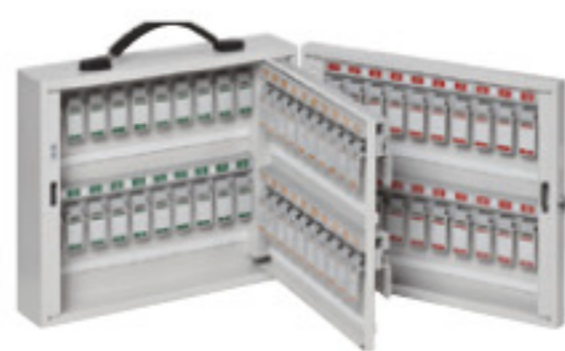
NKB-8 JAN 089910