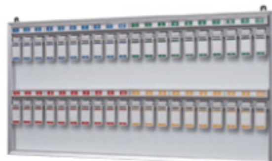
NKY-4 JAN 089958