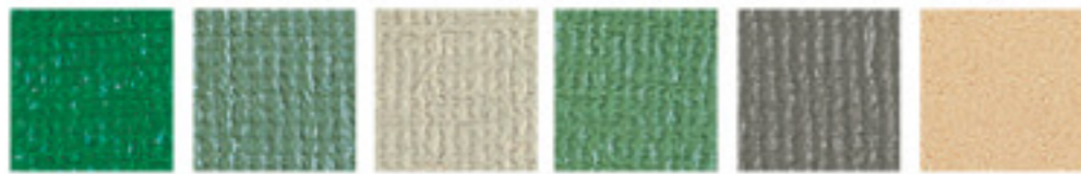
GN グリーン (L2003) LGN ライトグリーン (L2008) IV アイボリー (L2011) LM ライトメジウム (L2019) LGR ライトグレー (L2012) コルク