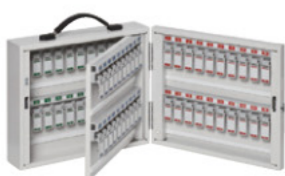
NKB-6 JAN 089903