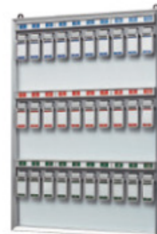
NKY-3 JAN 089941