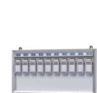
NKY-1 JAN 089927