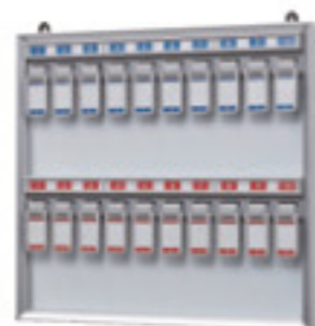
NKY-2 JAN 089934