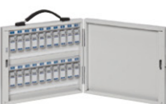
NKB-2 JAN 089880

仕様/本体: スチール 粉体塗装(グレー) フックホルダー: 樹脂成型品 入数: 1 ●鍵2本付 ●80個用